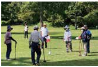
(黒川地区) 大会風景