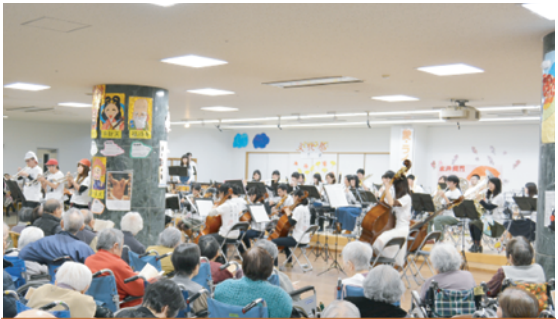
【熊本ユースシンフォニーオーケストラ】子供の頃から本物の音楽にふれ、オーケストラ活動を通してより良い社会人を育てる事を目的に設立され、以来、日本屈指のユースオーケストラとして活発な活動を行っている。