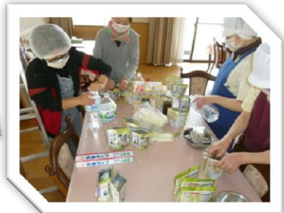
暖かいご支援 ありがとうございます

まだまだ 安心して寝床につける日々は遠いかも 知れませんが 入居者様・職員 元気で過ごしています