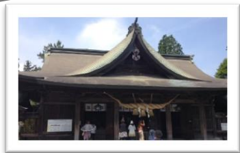
阿蘇神社本殿と楼門；平成 28 年 1 月