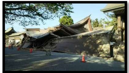
阿蘇神社本殿と楼門；平成 28 年 4 月 16 日